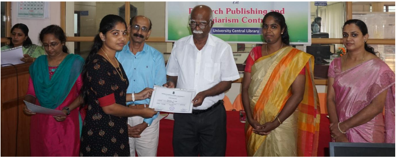
വിവിധ സർവ്വകലാശാലകൾ, കോളേജുകൾ, ഗവേഷണ സ്ഥാപനങ്ങൾ എന്നിവയിലെ 50 അദ്ധ്യാപകർ, ഗവേഷകർ, ലൈബ്രേറിയൻമാർ എന്നിവർ പങ്കെടുത്തു.