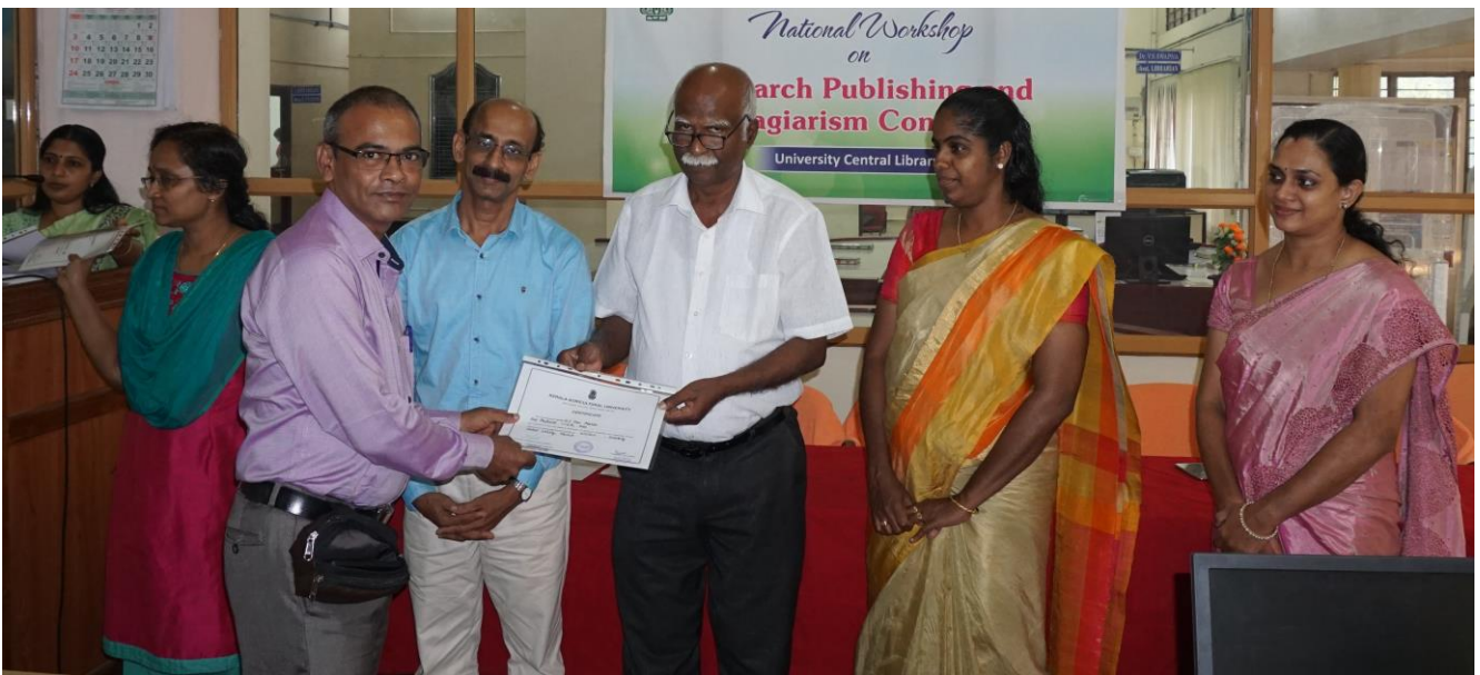
50 Teachers, Researchers and Librarians from different Universities, Colleges and Research Institutes participated.